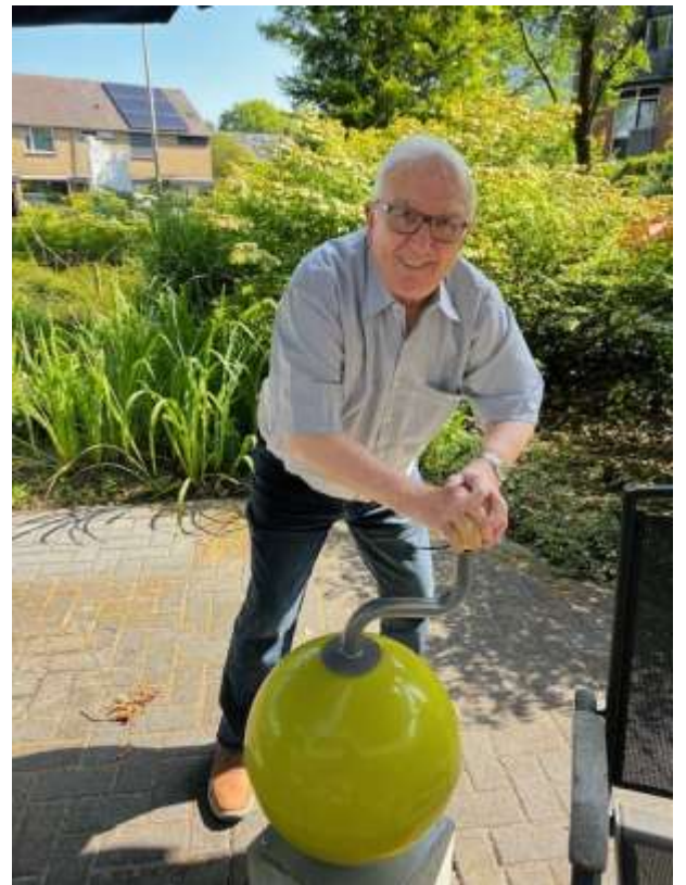
Daar zit muziek in